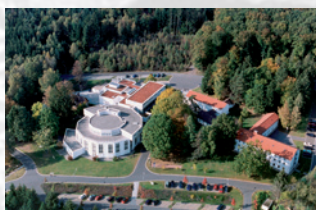
Europäische Akademie Otzenhausen

Die aus den Inhalten der Buchreihe entwickelten Lernmaterialien vermitteln auf Basis vielfältiger Methoden die Kernaussagen und Zusammenhänge der einzelnen Buchthemen. Als offene Erschließungsszenarien fördern sie mit anschaulichen Arbeitstexten die Schlüsselkompetenzen für nachhaltiges Handeln und bilden eine kompetente Grundlage für die Bildungsarbeit mit Jugendlichen und Erwachsenen.